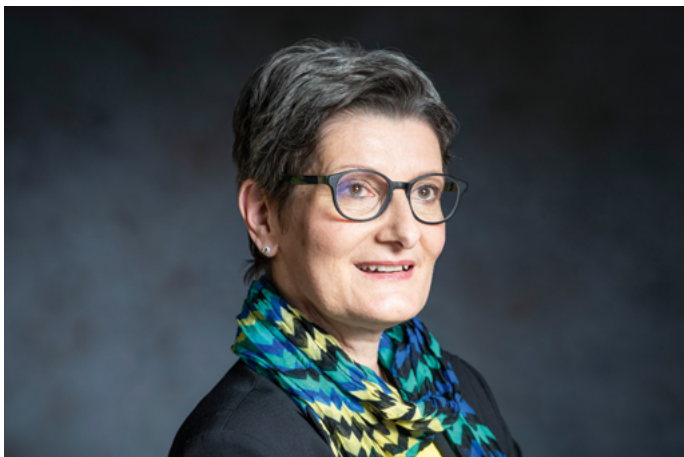
URSULA SCHNEIDER SCHÜTTEL Conseillère nationale et présidente du Conseil de fondation / Nationalrätin und Präsidentin des Stiftungsrates

L es personnes en situation de handicap – enfants et adultes – sont au centre des activités de notre fondation. Au sein du Conseil de fondation, nous sommes certes moins proches d’elles que les enseignants, les éducateurs spécialisés, les thérapeutes ou les infirmières. Néanmoins, il nous tient à cœur que les personnes prises en charge par notre fondation reçoivent le soutien et les encouragements dont elles ont besoin pour construire leur vie selon leurs souhaits, conformément à la Convention des Nations Unies relative aux droits des personnes handicapées.