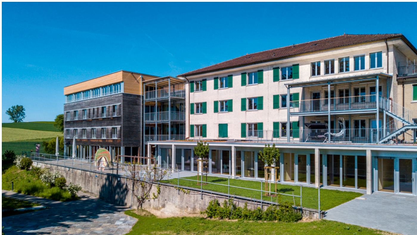
Les bâtiments rénovés et agrandis du HOMATO. / Der renovierte und erweiterte Gebäudekomplex des HOMATO.