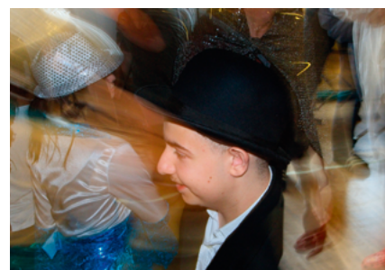
Impressionen des Musiktheaters «I have a dream», das am 24. Mai 2019 in der Aula der OS Tafers aufgeführt wurde.

Zeichen (lauter, leiser, «Stop» und «Go») findet sich die Gruppe, sie synchronisiert sich. Manchmal gerät alles ins Schwanken, kippt ins Chaos. Durch Impulse des Leiters findet die Gruppe wieder zusammen. Und plötzlich ein magischer Moment: Alle sind durch die Musik miteinander verbunden, jeder und jede ist auf seine persönliche Art Teil des Ganzen.